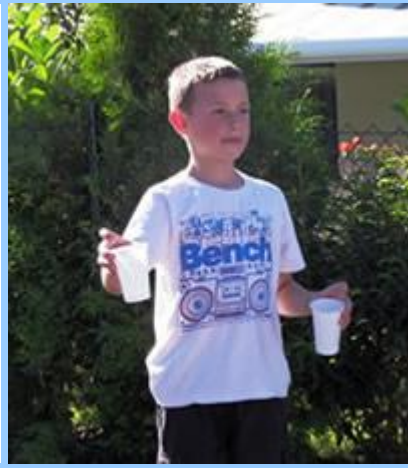
Viele private spontane Wasserstellen stillten den großen Durst des laufenden Volkes