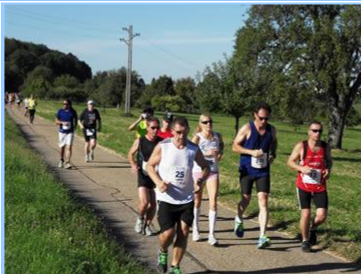
Gut bebrillt ist die halbe Miete: Bei strahlendem Sonnenschein geht's rund um Ettlingen