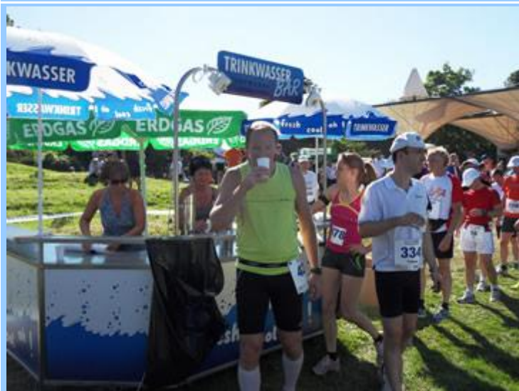
Aufgrund der heißen Temperaturen von über 30°C hatte die Wasserbar schon vor dem Start geöffnet